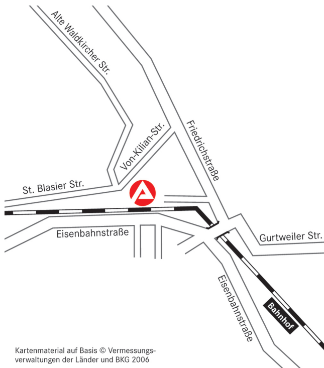
Kartenmaterial auf Basis © Vermessungsverwaltungen der Länder und BKG 2006